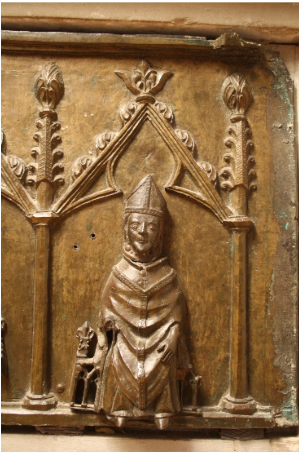
Fig. 4. Hellig biskop. Detalje af Christoffer II og Euphemias bronzestøbte gravmæle fra o. 1350 i Sorø Klosterkirke. Foto Ebbe Nyborg 2017.