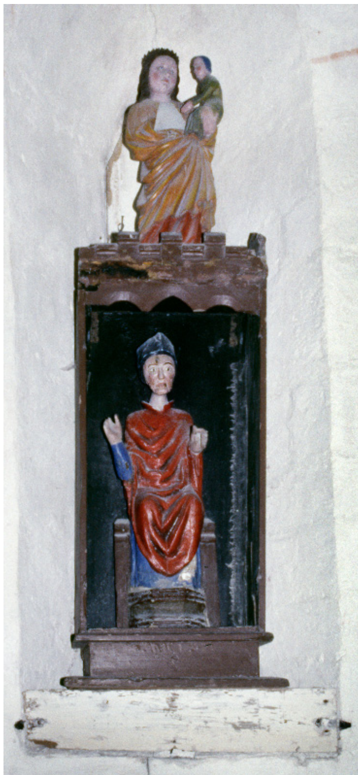
Fig. 3. Skt. Clemens' tavle og Mariafiguren. Foto Kjeld Borch Vesth o. 1990.