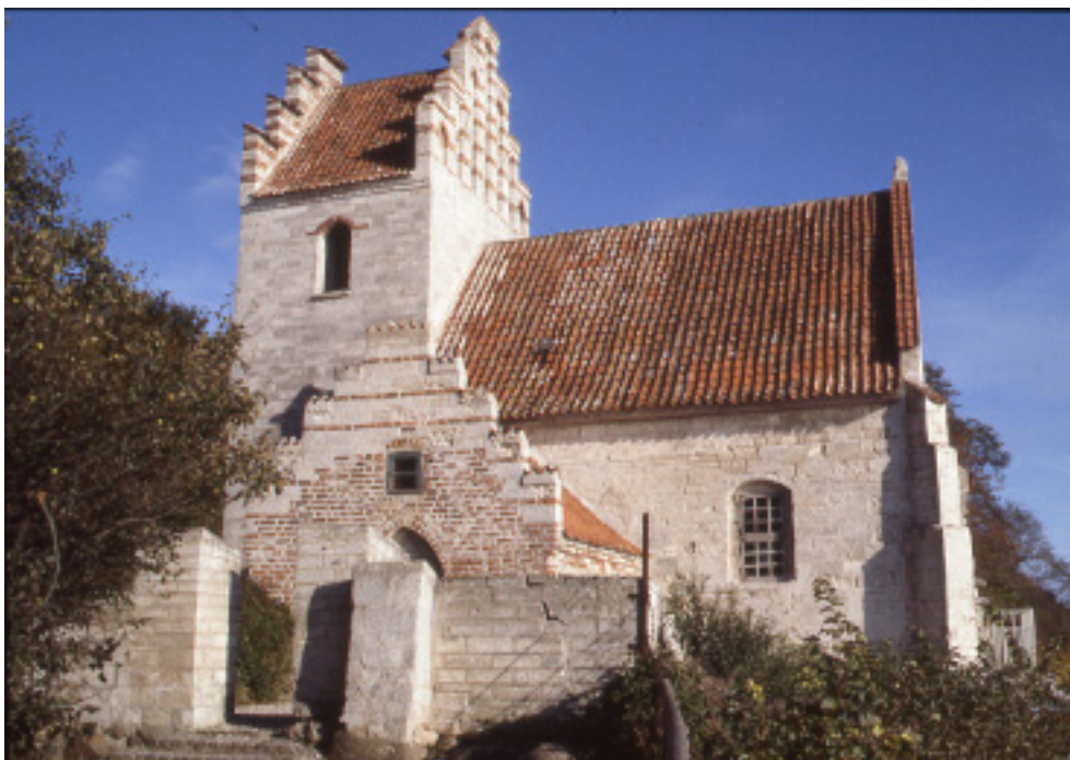
Fig. 1. Højerup kirke set fra sydøst med klintefaldet til højre. Foto Kjeld Borch Vesth o. 1990.