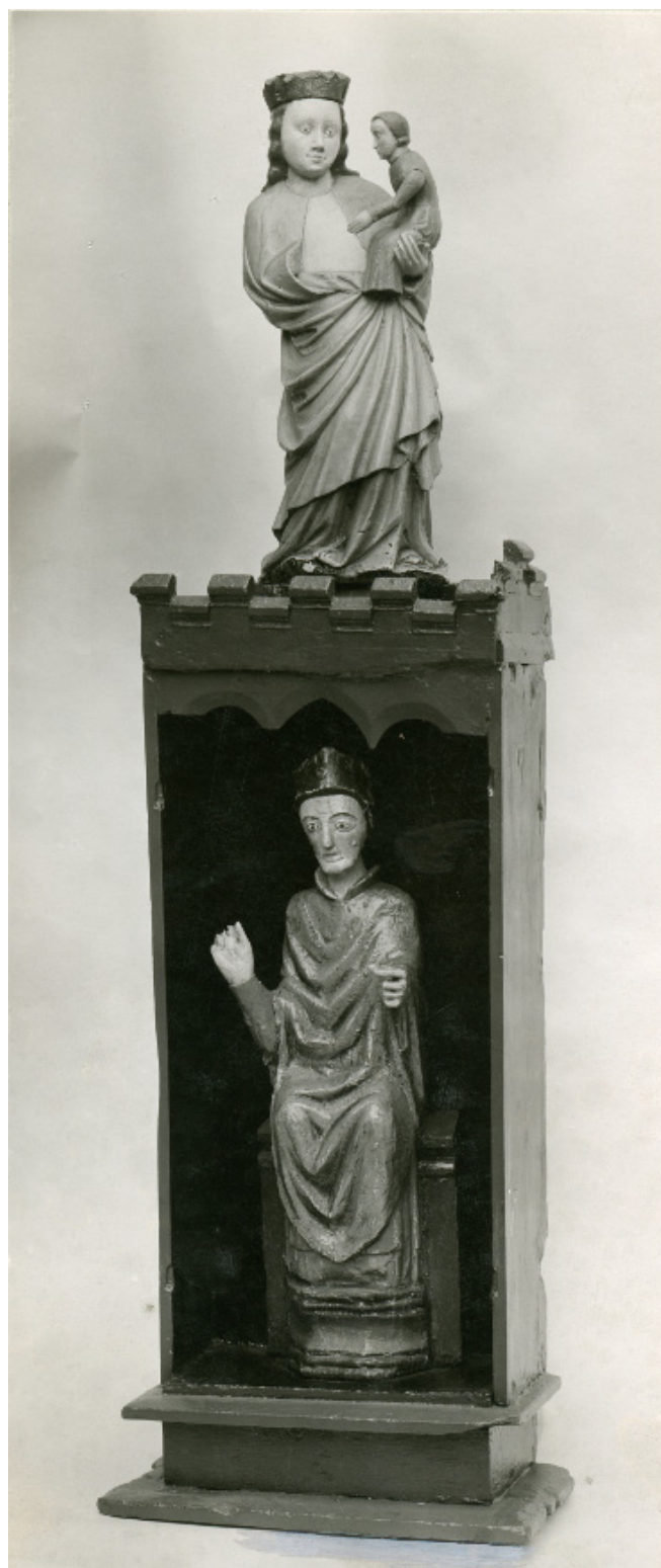
Fig. 2. Skt. Clemens' tavle med en lidt senere figur af Maria med Barnet ovenpå. Foto Sophus Bengtsson 1929.